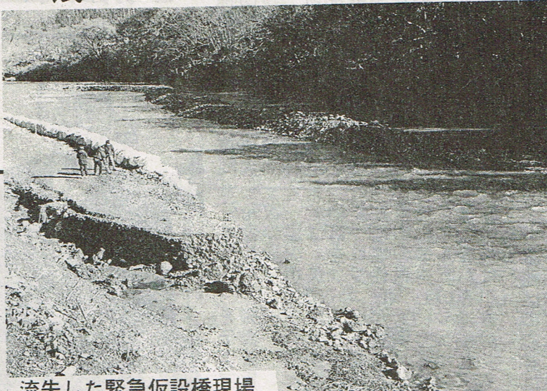
流失した緊急仮設橋現場

高地原地区住民11 28人のうち、朝の 16人は自宅に帰 らず、夜は館山ラ ン泊する。自宅に 泊る人の中には、 親戚の家に泊る 人もあった。地 区は、自宅に泊 る人が少なく、外 へ出ていく人が 多い。この状況を 打開するため、 町では、現在、 仮橋の復旧工事を 進めている。橋の 長さも、70mを 建設する。工事 中、延長70mを 建設する。工事 中、延長70mを 建設する。工事