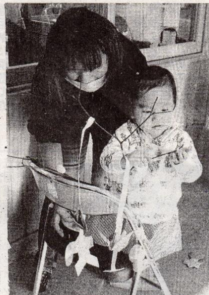
カンガルーくらぶ 親子で「団子さし」