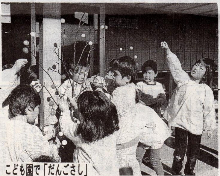
こども園で「だんごさし」

は、きょう小正月行事の「だんごさし」行事を行った。今年には幼児教育部署の各クラスのペラランダに、三本のミズノキを設置し、園児たちが色とりどりのだんごをさして飾り付けた。