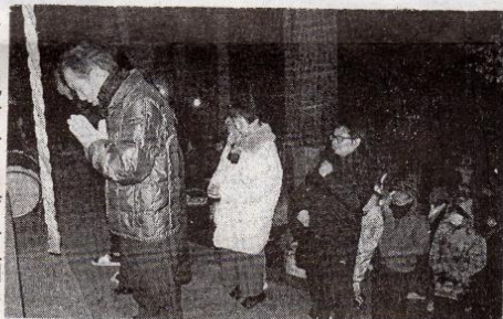
子の配布、ゆず甘酒を 進呈し盛り上げた。

良き年に願いを込めて 町内神社仏閣初詣で 東館神社でコラボ企画 ゆず甘酒・ゆず等配布 平成三十一年の新年明けには、町内の神社仏閣に元朝初詣での参拝者が訪れ、新しい年の祈願をする人たちが賑わった。