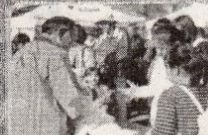
ジャンケンでゲット!