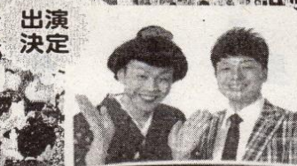
出演決定 母心の爆笑漫才!