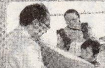
豪華景品!お楽しみ!