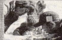
早食いチャレンジ!