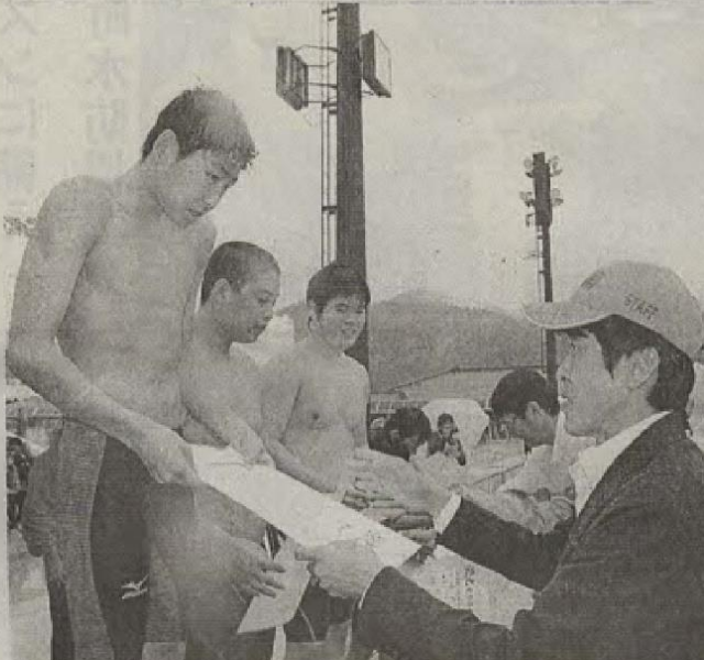
に四百m自由形、個人