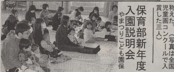
保育園新年度 入園説明会 やまつりこども園保 称えた。(写真は全国 児童画コンクールで入 賞した三人)

挑賞が状児窪陽児増品矢も施グ部児ルの伝文第(や 戦わを表贈と)谷ち窪陽児増品矢も施グ部児ルの伝文第(や しと祝彰ら記が匡やが琉た店児れ|学画毎国賞と十(益 たび福式れ念入紘ん優愛ををは、省振興新童表わ十(益 園大すで品(と)選ちや賞、のつに、主社、日、ク、つ、録、表、画、 児のとの三た。メ)なん(三)賞、のつに、主社、日、ク、つ、録、表、画、 の健記と人。ダ)る(五)藤(四)果、のつに、主社、日、ク、つ、録、表、画、 闘録ものルて(五)藤(四)果、のつに、主社、日、ク、つ、録、表、画、 をにに入)等賞歳と千歳出ルど実C本文|た。会彰