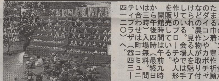
四テいはか を作りけなのたく 一イ合ら開販りてらどのイるま 二プわ時午館売のいれのイるま 〇ラせ)後時しづる、農コ巾の )ザは入四間て口。見作ン着、ズ へ。(町場時は|會る物や、豊 )コ無(午るち場人が力か作 四ミ料最前。やでを取ボ祈金 三ユ。終九 人は魅リチ祈金 |二問日時 形手了付ヤ願が

どど願にし支つ図が 幼をて 八歳一説育 行説い関、援たり一説児含順四名児た時明部 つ明、すそし指な園明をめ次月が。半会の たし準るのて導がと会保て入か新二から十九 、備お後行庭はす十、月す八 用すら接”い年が益る七、月す八 品もせやと成齡連子名在にる。まはで 文のと保挨長に携園の園か。で ななお育拶を合を長乳児け十〇開後