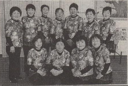
矢祭町関係ではに に矢祭町関係ではに に矢祭町関係ではに

レ団リリフ し一矢一ロヨ祭スレ一「ダ デ体一、トまた北祭ラモ一ガヨ一イルドソ「女 イの折た上町スニ一花ガアケアリソ「つて 一粘り写手芸、 品工紙真、 展芸タつエ 示などスレク 祭さト飾ラ