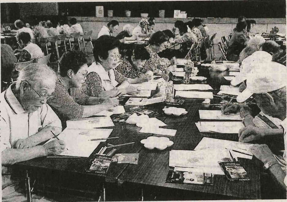
「大人の塗り絵」に挑戦 約五十人参加し 平成大学第三回学習講座

講平成大学第三回学習講座に約五十人参加し「大人の塗り絵」に挑戦 講平成大学第三回学習講座に約五十人参加し「大人の塗り絵」に挑戦 講平成大学第三回学習講座に約五十人参加し「大人の塗り絵」に挑戦 講平成大学第三回学習講座に約五十人参加し「大人の塗り絵」に挑戦 講平成大学第三回学習講座に約五十人参加し「大人の塗り絵」に挑戦