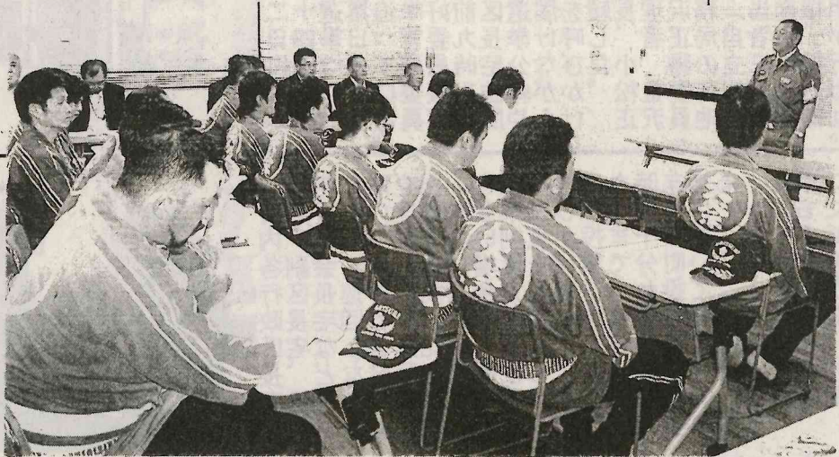
少年ドッジボール大会の様子。参加者たちは真剣な表情で試合に臨んでいる。

防犯協会東館支部は、8月4日に少年ドッジボール大会を開催し、防犯パレード、年末診断など計画を立てている。また、地域安全の推進を図るため、防犯協会東館支部が総会を開催し、今後の活動方針を決定した。