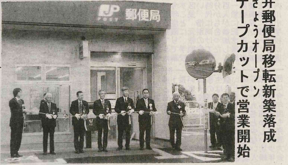
なり、利便性を図るため、新築移転したもので