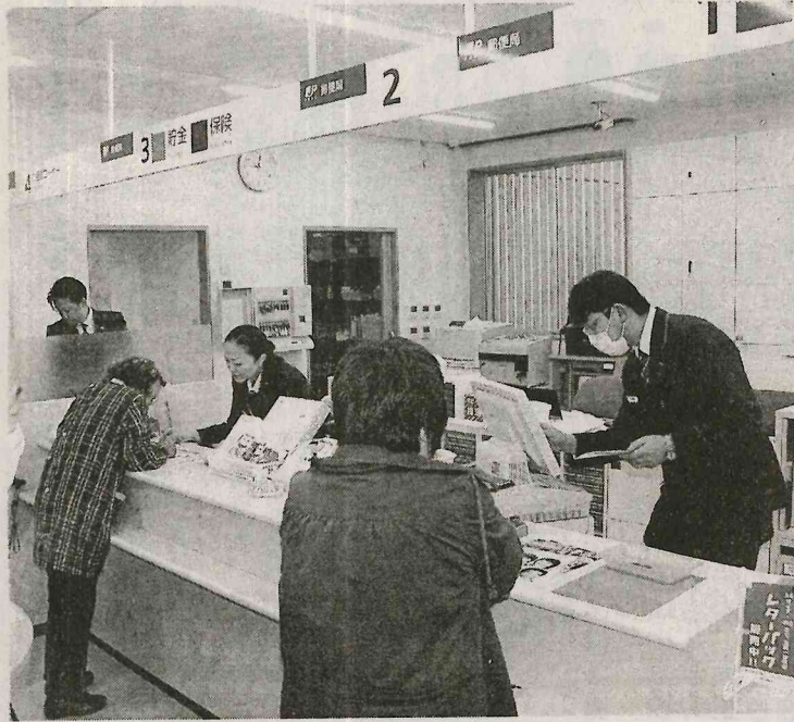
す。これからも小さくても輝く郵便局、お客様を笑顔にしてまいります