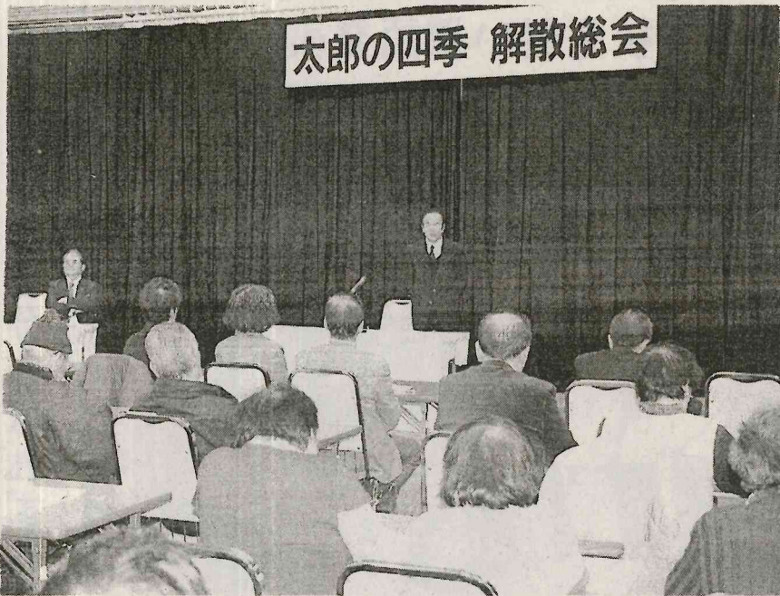
太郎の四季 解散総会