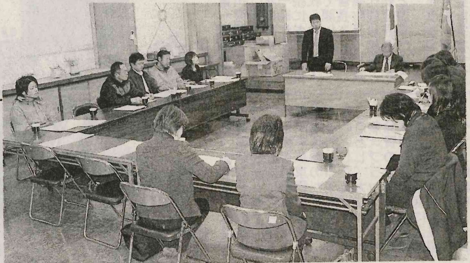
子ども・子育て会議の発足は、教育と保育の一元化など支援強化の目的を達成する。新制度に伴い、支援事業計画策定案の審議が行われた。

矢祭町子ども・子育て会議は、3月4日(水)午後7時、町会議員会議室で開き、委員17人を委嘱し、教育と保育の一元化など支援強化の目的を達成する。新制度に伴い、支援事業計画策定案の審議が行われた。