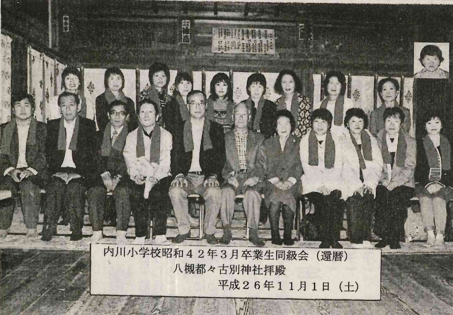
内川小学校昭和42年3月卒業生同級会 (還暦) 八槻都々古別神社拜殿 平成26年11月1日 (土)

多浩てる中九会会川 いさ本。山時には地区 るの年区からによるの 。参をも末集二一そ 準加講天恒会二新そ 備者師神例所でー日 のをに沢行開日そ打 都合募開の事開日打 上し集古催ウ前ち好