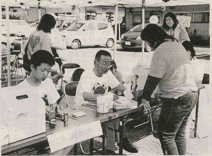
街頭でチャリティー募金 町社協と奉仕団 二十四時間テレビに協賛

赤十字会(矢祭町社会福祉協議会)の職員が、24時間テレビに協賛する。赤十字会(矢祭町社会福祉協議会)の職員が、24時間テレビに協賛する。赤十字会(矢祭町社会福祉協議会)の職員が、24時間テレビに協賛する。