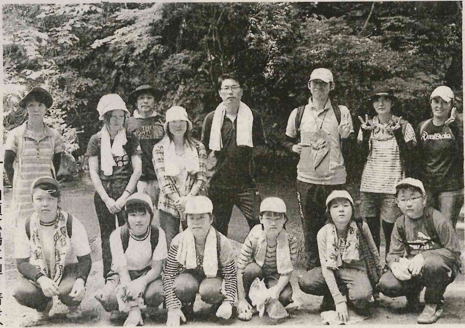
山頂の里の協力で、滝川の里の協力で、着き、食