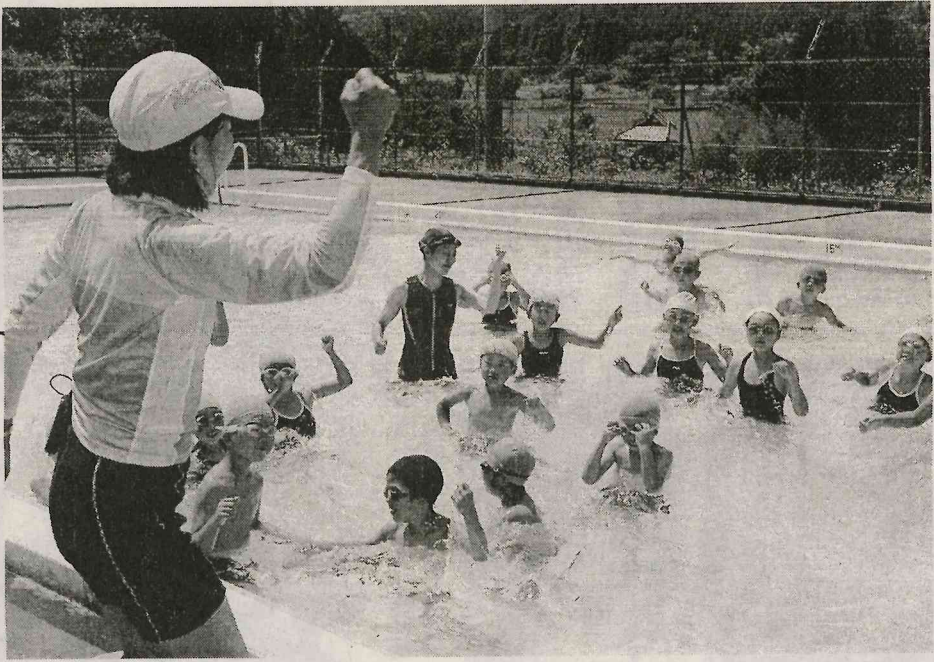
猛暑の下若鮎飛び跳ねる 下関河内小で アクア(水中)ビクス教室

八四 施童動満で運で泳ア運実ン加 スて分よ子 度きし防あ動いシク動さし全教アかう洋下 以上育の止るのーア実ト校室クから三校河内 と炎う成このこバもズビ技をラエ児をア、校校(プ時長) なるで陰る好か、ス、取はをにービ先。水ー)に時は、 猛はでたきら小が休り毎行、添ク生。中ル十で、 暑三三めなも児大養組年っ水田スが、ビお二、 と十実児運肥切とん水た。中夏イ参 クい十き金