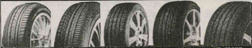
EAGLE RV-S AS-1 TR-106 Playz PZ-X HP SPORT