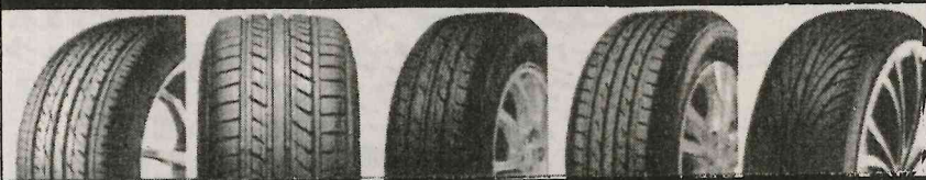
GT ECO-Stage EAGLE LS EXE ECOPIA EX10 NEXTRY NS-2