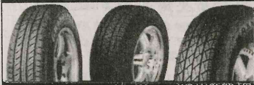
PT-2 H/L 683 WRANGLER HP

タイヤハウス RSK 118号県道 0295-72-5573 夏タイヤ お買得価格