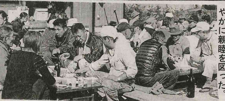
やかに親睦を図った。

小田川区民祭の恒例行事として、今年も高塔山ハイキングが実施された。参加者は、区民だけでなく、近隣の住民や家族連れも多く参加した。ハイキングのスタートは、高塔山の山頂から行われ、約1時間かけて山頂まで歩いた。参加者は、ハイキングの楽しさを語り合ったり、写真を撮ったりしていた。ハイキングの後は、区民祭の会場に戻り、お弁当を食べたり、交流したりした。ハイキングは、区民の親睦を深め、健康増進に役立つとされている。