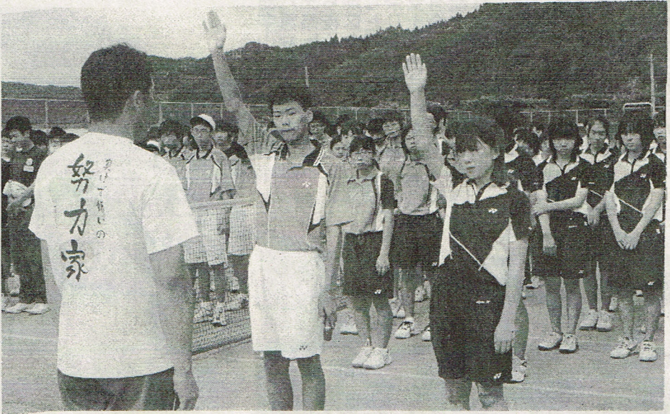
雨のため当初十四日 の日程は十六日に変更 し、十五日は小学生の 部、高校・一般の部の 試合が行われた。

財団法人矢祭振興公社主催、矢祭ソフトテニス大会は、矢祭振興公社杯争奪ソフトテニス大会として、今年も盛況を収めた。大会は、矢祭振興公社杯争奪ソフトテニス大会として、今年も盛況を収めた。大会は、矢祭振興公社杯争奪ソフトテニス大会として、今年も盛況を収めた。