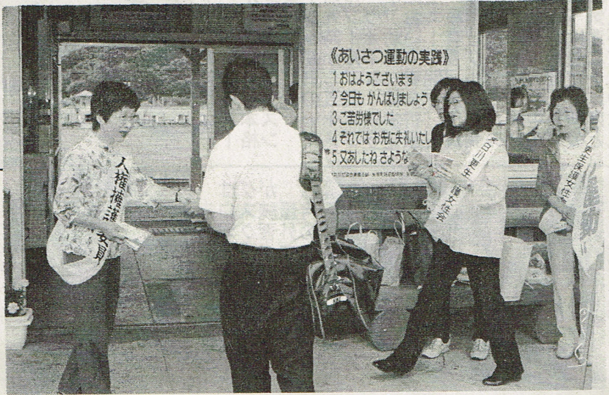
《あいさつ運動の実践》