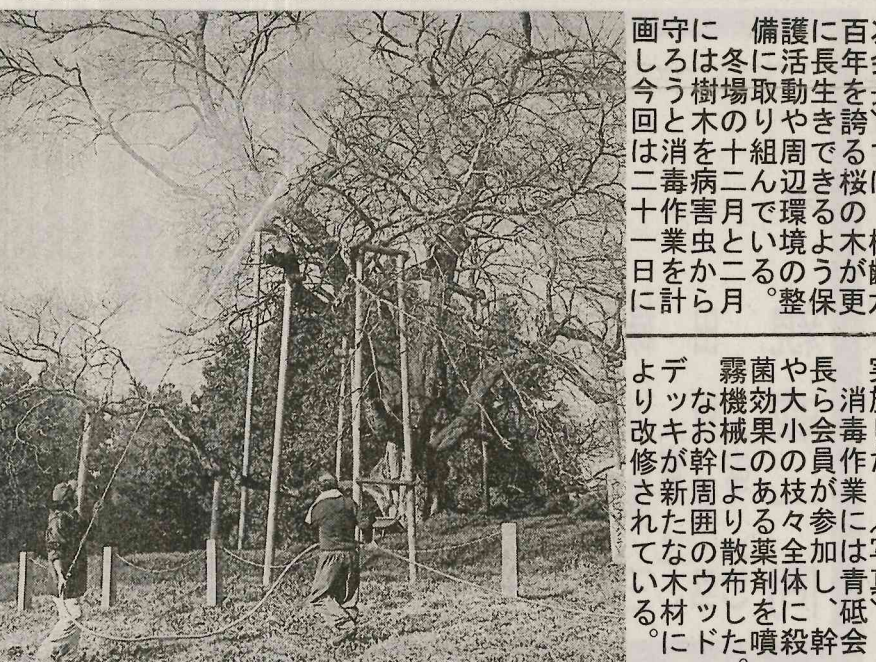
戸津辺の桜を 病害虫から守る 消毒作業

矢祭町中央公民館教育委員少年部主催の「矢祭町スポーツ大会」が、25日(火曜日)午後8時から、同館の体育館で開催された。この日は、男子ソフトボール、女子ソフトボール、男子バレーボール、女子バレーボール、男子バスケットボール、女子バスケットボール、男子サッカー、女子サッカー、男子野球、女子野球、男子ソフトテニス、女子ソフトテニス、男子卓球、女子卓球、男子バドミントン、女子バドミントン、男子空手道、女子空手道、男子柔道、女子柔道、男子剣道、女子剣道、男子少林寺流、女子少林寺流の各競技が行われ、盛況を呈した。