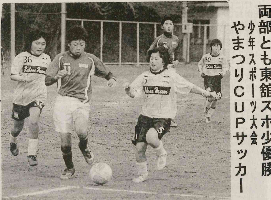
両部とも東館スポーツ少優勝 少年ソフトボール大会 やまつりCUPサッカー

矢祭町中央公民館教育委員少年部主催の「矢祭町スポーツ大会」が、25日(火曜日)午後8時から、同館の体育館で開催された。この日は、男子ソフトボール、女子ソフトボール、男子バレーボール、女子バレーボール、男子バスケットボール、女子バスケットボール、男子サッカー、女子サッカー、男子野球、女子野球、男子ソフトテニス、女子ソフトテニス、男子卓球、女子卓球、男子バドミントン、女子バドミントン、男子空手道、女子空手道、男子柔道、女子柔道、男子剣道、女子剣道、男子少林寺流、女子少林寺流、男子少林寺流、女子少林寺流の各競技が行われ、盛況を呈した。大会は、午前8時から午後8時までの間、同館の体育館で開催された。この日は、男子ソフトボール、女子ソフトボール、男子バレーボール、女子バレーボール、男子バスケットボール、女子バスケットボール、男子サッカー、女子サッカー、男子野球、女子野球、男子ソフトテニス、女子ソフトテニス、男子卓球、女子卓球、男子バドミントン、女子バドミントン、男子空手道、女子空手道、男子柔道、女子柔道、男子剣道、女子剣道、男子少林寺流、女子少林寺流の各競技が行われ、盛況を呈した。