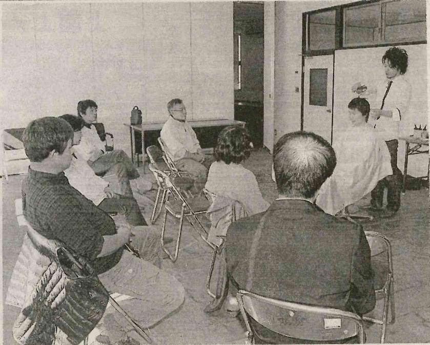
ポイントパーマなど講習 商工会館で 東白川郡内理容同業組合

同北ルル能ルシ第ン福 テ客一長ワつ白同 て村会前講 全理獲(五優カ四バ島普一満ポイの石業福開理館十習東 国容得(福勝ル十一県野マ足とイ野ル後、秀組島いた。師におから、郡白川 大競)島全、カニジ理氏でとン功ド、ヘア(福島一長支東理。会いて矢二内 会技を、県国第三ト同セ競第は受単価一(島市)サあ川容 出大はで大会三&大会ツ大七た。講しUマを講師)を講市)サあ川容 場大はじめ初会九ス大会ト大七た。講しUマを講師)を講市)サあ川容 な準のの銅九ス大会ト大七た。講しUマを講師)を講市)サあ川容 等優、メメ回タク優会七。の願に店さの生 数勝東ダダ技イラ勝ポ回の願に店さの生