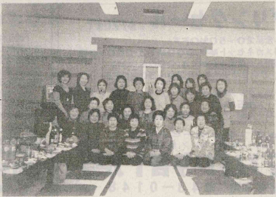
楽しかった「淡島講」 山野地区婦人が和やかな宴

一員河愛さにフーニオ祝入詣りおくおり加子た淡パ 緒がフ好んーラ大人ケ賀りりま祝お産ま者さ。島ル二 に交ラ会音もダ阪ずがの、をしの産をし、ん今講矢月 踊互ダの頭っすつ次舞大した酒をしたと。年が祭二 つにン会「たスず組々を森た。がなた。て二の開で十 た踊ス員フいのめにに踊春後淡五さりまも十宿催山七 りっのニラな準「な歌り美、島本る、ず盛八はさ野日 とた会名だい備をつわ、さ宴様も家間今り名篠れ井に 、りのとンぱの踊てれカん会に上かも年上の田ま区ユ 華、会白スあ間り、うがにおがらな度が参幸しの！