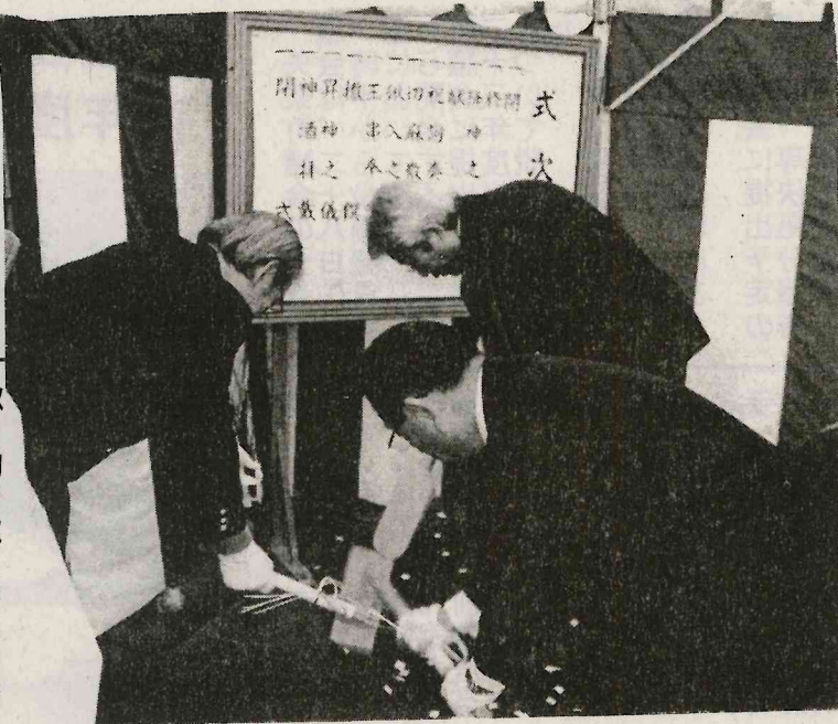
SMC第三倉庫棟を新築 第一工場敷地で「地鎮祭」