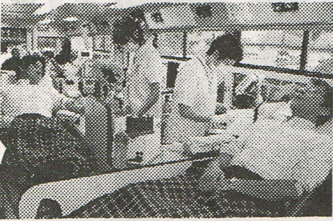
血液センターバス来町 献血に四十五人が協力