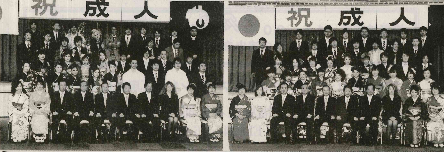
平成23年矢祭町成人式 記念撮影