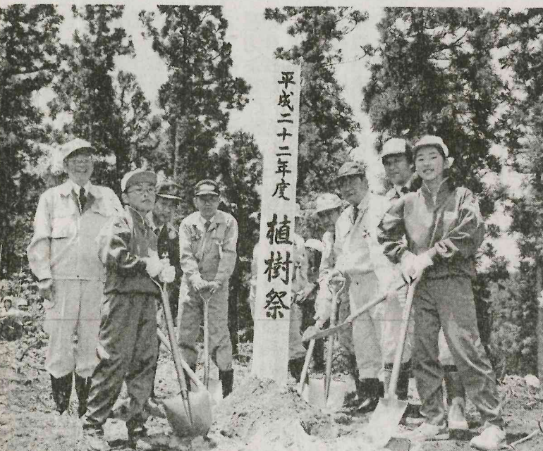
平成二十二年度 植樹祭。参加者は、東白川町、西白河町、矢祭町、国府川町の自治会、町商工会、市商工会、町内各小学校の児童、市民、有志者が約百五十名参加した。植樹は、矢祭町、西白河町の各小学校の児童が中心となり、約百五十本の苗木を植樹した。植樹場所は、東白川町、西白河町の各小学校の児童が中心となり、約百五十本の苗木を植樹した。

東白川西白河中学陸上矢祭中選手が大活躍。また、観光客の誘致を図る。また、観光客の誘致を図る。