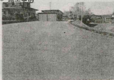
* K氏邸アスファルト舗装