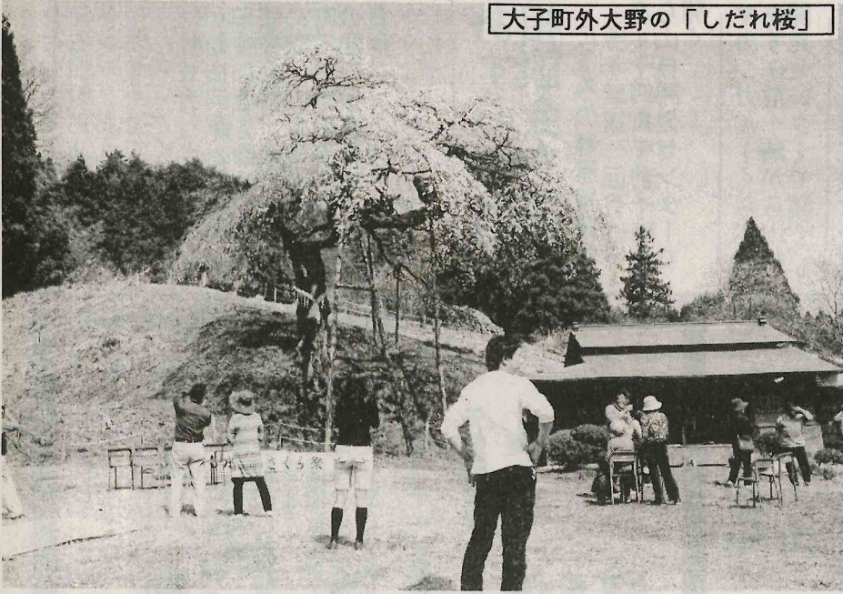
大子町外大野の「しだれ桜」

何の隣しで動 い度接た十し木 たも慈の。五、県 。飛川矢防回両 。来から町へ散の防 （写真）り取原はを災 返水地県実災へも しし内境施り出