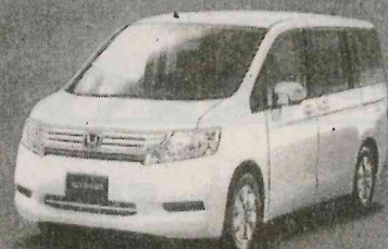
クラス初3列目床下格納シートで荷室すっきり。