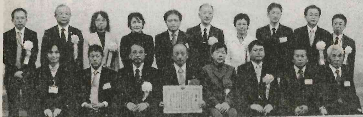
平成21年度 豊かなむらづくり全国表彰式 東北ブロック表彰式

豊かなむらづくり全国表彰式 仙台市で東北ブロック表彰式 滝川溪谷直売所再び受賞 農政局長賞 豊かなむらづくり全国表彰式 仙台市で東北ブロック表彰式 滝川溪谷直売所再び受賞 農政局長賞