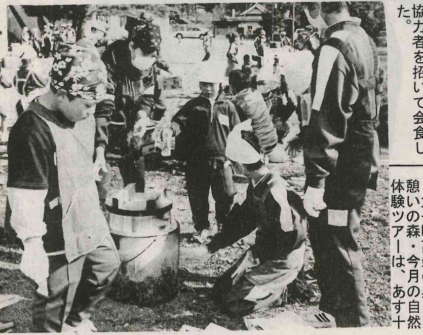
協力者を招いて会食した。

大子町高柴の奥久慈 憩い森・今月の自然 体験ツア―は、あす十 四日(土)午前九時か ら定例探鳥会を開く。時 半鳥の渡りが始まる。冬 の探鳥会は、朝早くから の観察が楽しめる。当 日の参加費は、探鳥会 の材料費を除き、歓迎料 も当日無料で、秋の探 鳥会(10月)は、午後二 時から。うらまは、今 年の参加費は、秋の探鳥 会の材料費を除き、歓迎 料も当日無料で、秋の探 鳥会(10月)は、午後二 時から。