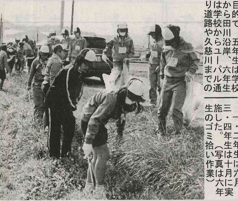
東館小児童が地域清掃活動。東館小児童が地域清掃活動を行った。

東館小児童が地域清掃活動。東館小児童が地域清掃活動を行った。東館小児童が地域清掃活動を行った。