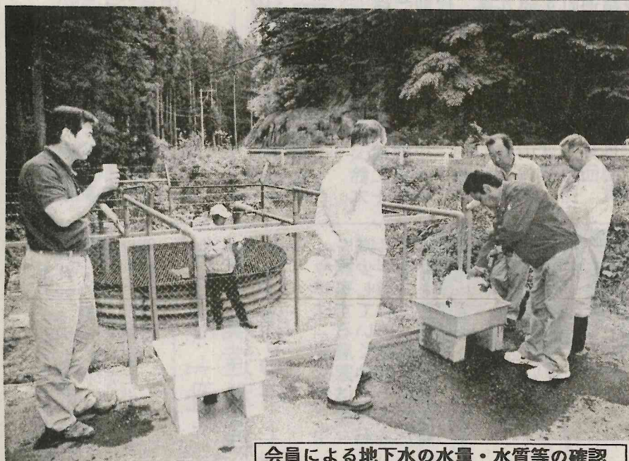
会員による地下水の水量・水質等の確認

矢祭町の特産品「矢祭の水」の発祥は、昭和21年(1946年)に、矢祭町商工会が、矢祭の水の製造を始めた。矢祭の水は、約100年前の花崗岩をすりつぶし、ろ過した地下水で、天然のアルカリイオン水である。矢祭の水は、矢祭町の特産品として、全国的に有名になった。矢祭の水は、矢祭町の観光資源として、積極的に推進している。