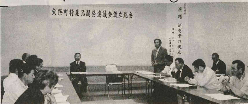
矢祭町特産品開発協議会設立総会

味の交流には、矢祭の水が、矢祭の水の国産水です。矢祭の水は、約100年前の花崗岩をすりつぶし、ろ過した地下水で、天然のアルカリイオン水です。矢祭の水は、矢祭町の特産品として、全国的に有名になった。矢祭の水は、矢祭町の観光資源として、積極的に推進している。