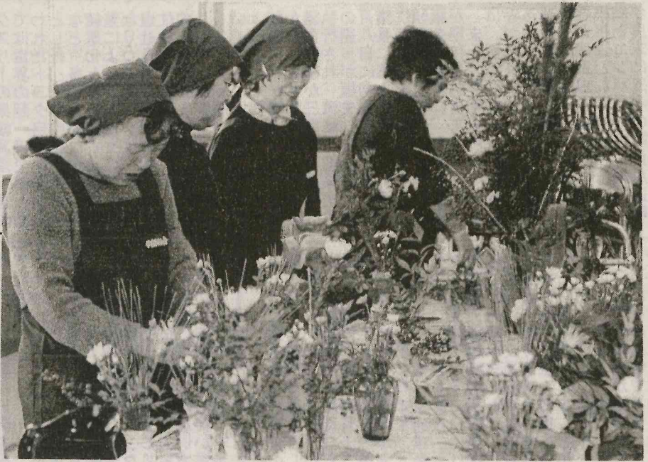
ユーアイ、せせらぎ荘の やまゆりの会 玄関、居室に生花を飾る

入立 二 十 一 年 度 の 矢 祭 町 所 幼 稚 園 児 童 募 集 五 た 花 施 居 な か 一 て 瓶 け の ホ 十 施 木 員 は り 。 瓶 設 室 花 、 ネ 、 な 花 作 正 一 し 全 正 会 ラ の に 玄 へ や 万 一 松 ど 瓶 業 用 ム 人 た ム 員 正 月 ( 佐 テ イ 飾 関 の 木 兩 シ や 三 や を 生 せ よ に 末 よ を 前 川 典 ア や ま 付 の ミ を な ヨ 南 十 ミ 行 せ せ る 続 大 掃 ユ に 典 子 会 長 け 大 生 意 色 、 菊 、 を 花 た 花 ら ユ き 除 一 し て 会 設 き 花 し て や ざ 、 用 瓶 。 飾 ぎ ー 役 を ア て 会 置 目 と て や ざ 、 意 小 付 へ イ 員 実 イ