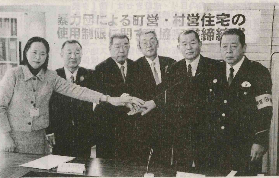
暴力団員による町営・村営住宅の 使用制限に関する協定書締結式

決 定 偽 偽 偽 定 の 渡 が つ 定 定 ど の 請 明 入 居 場 合 暴 力 団 員 明 の 渡 が つ 定 定 ど の 請 明 入 居 場 合 暴 力 団 員