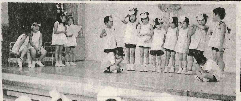
四は▼関岡小学校の運動会 十五分前開く。八時