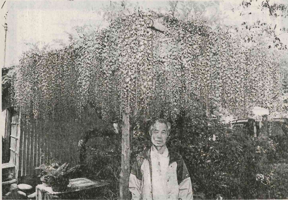
今が盛りと咲き誇る藤の花